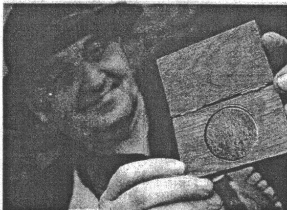
Iskovani metalni novčić postat će suvenir Broda